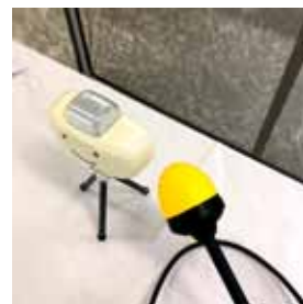
MS カスタム 電界測定 (距離)

計測された数値上、ペースメーカー・ICD への電磁干渉の可能性は無いと言えます。