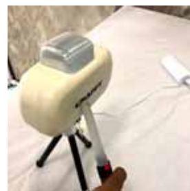
MS カスタム 静磁界測定

計測された数値上、ペースメーカー・ICD への電磁干渉の可能性は無いと言えます。