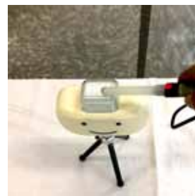
MS カスタム 静磁界測定

計測された数値上、ペースメーカー・ICD への電磁干渉の可能性は無いと言えます。